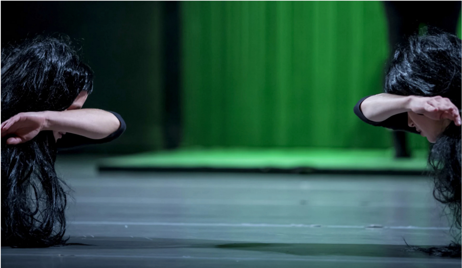
"מפלים". עוד ועוד אפשרויות של יופי