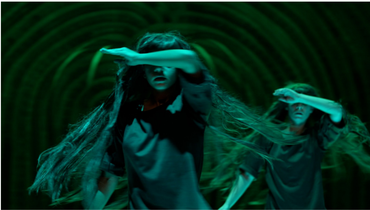
מתוך "התעלפויות". כמו להתעורר מחלום בהקיץ

מרבית היצירה מבוצעת בדיוק מופתי, שבו שלוש הרקדניות נעות כאחת: שרועות על גחונן, פניהן נסתרות מעיני הצופים, מנתקות חזה ורגליים מן הקרקע, מקשיות את הגו לאחור ותוחבות את פניהן בגומת מרפקן, וכך נאנקות בקול; יושבות על הברכיים, מניפות ידיים כמבקשות להתנתק מן הקרקע ולעוף ומצליחות בכך לרגע, שלושתן באוויר יחדיו, ומיד שבות אל הברכיים; בעמידה, ידיהן סבות במעגלים, נעשות להבים של שבשבות אנוש מחוללות אנרגיה בתיאום מושלם; מתקדמות תוך ביצוע תנועה גלית, מכנית-חושנית, שבה האגן נדרך לפנים והברכיים נטרקות לאחור, משמיעות נהמה בעודן מעלות אט אט את ידיהן מעלה, מקיפות כך את הבמה במעגלים, בתנועה קצבית, פועמת, מבלי לשבור את המבנה המשולש שבו הן ממוקמות בחלל.