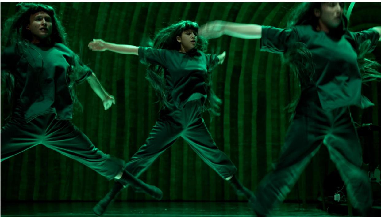
"התעלפויות". שוב ושוב מבצעת מציאות פנימית רוגשת, סוערת

ביצירתה "התעלפויות" עוסקת נינה טראוב במאבק המתמיד שבין הפראי למבוית ושואבת את הצופים לחוויה מתעתעת בזמן